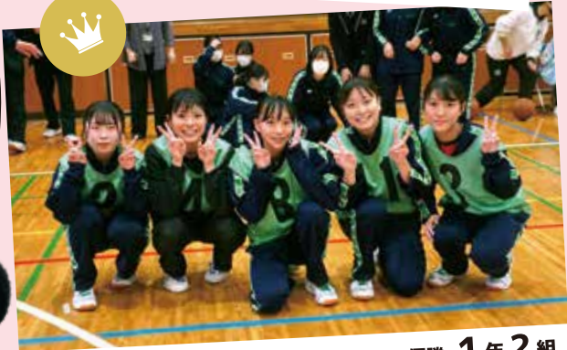
女子バスケットボール優勝 1年2組