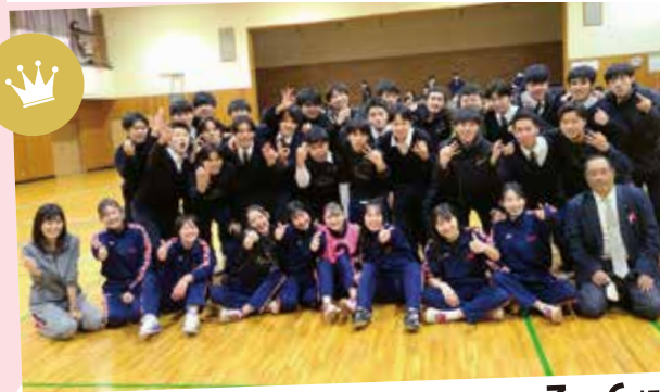
女子ドッジボール優勝 3年6組