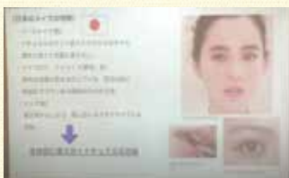
日本と海外の美容