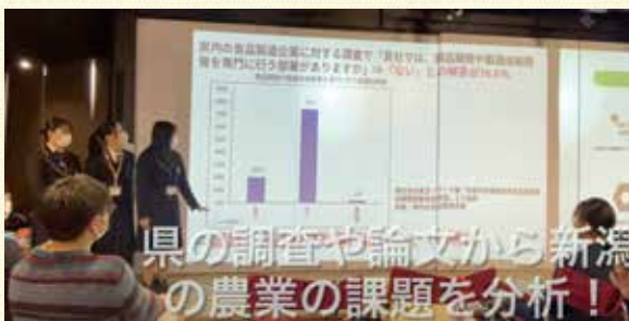
ル・レクチエの商品化プロジェクト

12月末に探究学習の発表会が行われました。この発表会では調査したテーマについて資料を作成し、プレゼンテーションで成果の確認をしました。「日本と海外の美容」、「ル・レクチエの商品化プロジェクト」といった日常生活と関連したテーマを専門職や地域の方々と協力することで、深い学びにつなげることができました。