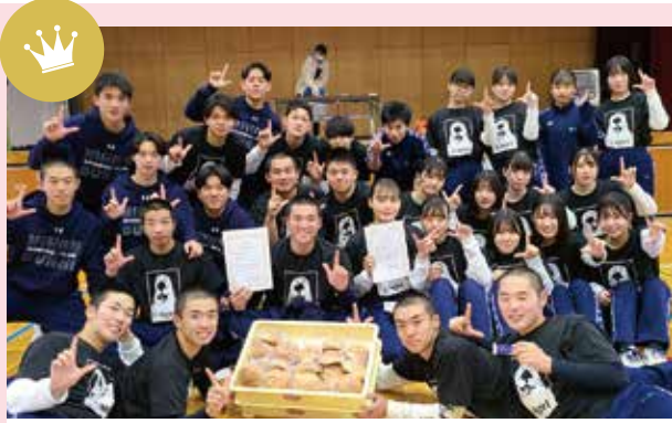
男子ドッジボール優勝 2年4組