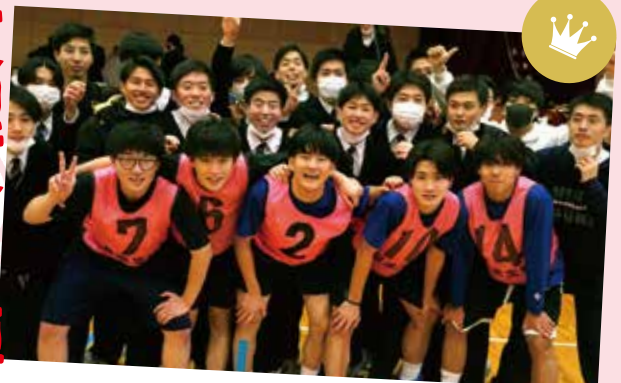
男子バスケットボール優勝 3年5組