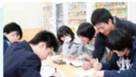
新潟大学生チューターによる補習(寮生)